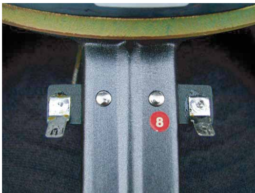
旧タイプのドライバーと端子形状

STドライバーは、写真に示されているように入力端子がタブ端子からスピーカ端子に変更されました。